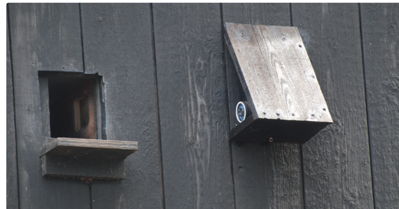
De buitencamera (nieuw in 2011) staat gericht op het aanvliegplankje.