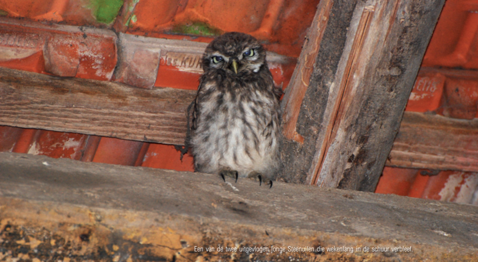
Een van de twee uitgevlogen jonge Steenuilen die wekenlang in de schuur verbleef.