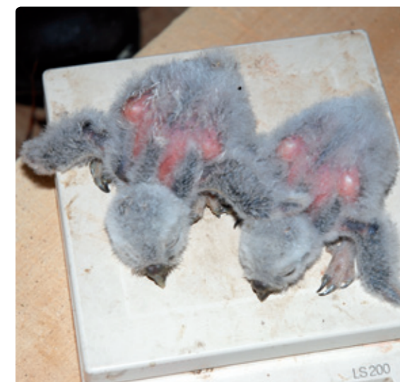
De twee jongen tijdens het wegen.