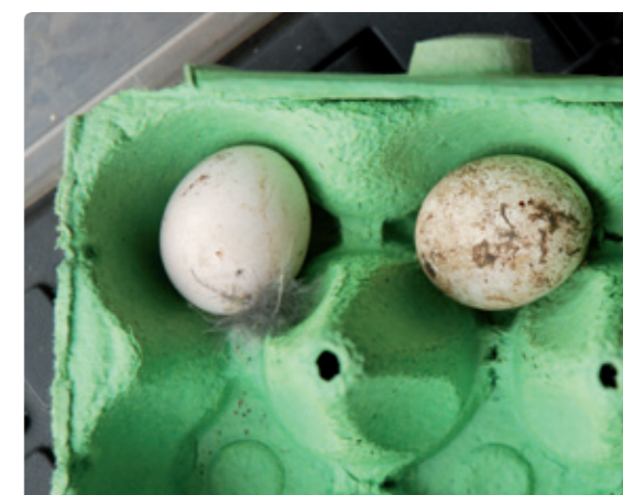
De twee niet uitgekomen eieren.